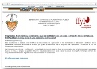
Figura 2.: Cuestionario disponible en la plataforma Blackboard

El cuestionario se aplicó a los 53 profesores a través de la plataforma instruccional Blackboard, mismo que estuvo disponible a partir del 10 al 13 de diciembre 2011. Tal como se muestra en la siguiente figura: