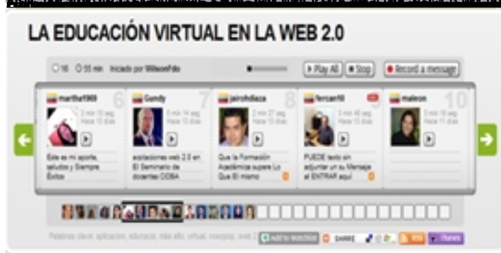
Figura 19. Captura de pantalla de un aula virtual en un entorno de aprendizaje colaborativo en la Web 2.0