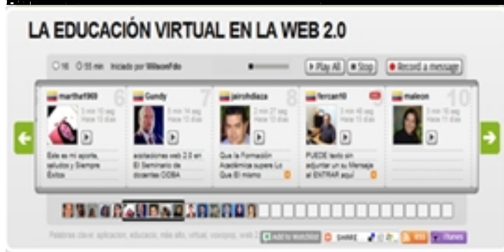
Figura 19. Captura de pantalla de un aula virtual en Moodle.