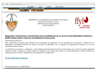
Figura 2.: Cuestionario disponible en la plataforma Blackboard

El cuestionario se aplicó a los 53 profesores a través de la plataforma instruccional Blackboard, mismo que estuvo disponible a partir del 10 al 13 de diciembre 2011. Tal como se muestra en la siguiente figura: