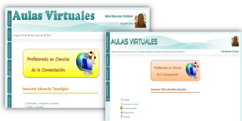
Fig. 2: Aulas extendidas de dos materias del profesorado.

A modo de ejemplo la Fig. 1 muestra el aula extendida de dos de las materias, Seminario Taller: Informática Educativa y de la materia Seminario Educación Tecnológica, tal como la visualizan los alumnos.