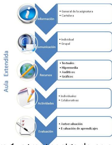
Figura 1. Componentes de un aula extendida. El profesorado se toma en cuenta cinco componentes: Información, comunicación, recursos, actividades y evaluación.